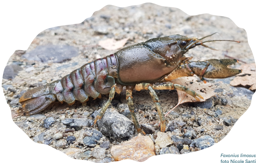
Faxonius limosus

È una specie medio-piccola, con dimensioni massime degli adulti intorno ai 12 cm. La colorazione è bruno-olivastra, il cefalotorace presenta numerose spine e l'addome riporta una serie di macchie rossastre, che ne aiutano il riconoscimento. Le chele presentano una spina sul carpopodite, e il margine interno è liscio e non seghettato. Preferisce vivere in laghi e fiumi di pianura a lento decorso, ma è capace di adattarsi a una gran varietà di condizioni, consentendogli di sopravvivere anche a quote piuttosto elevate e di sopportare acque povere di ossigeno e periodi di siccità prolungati.