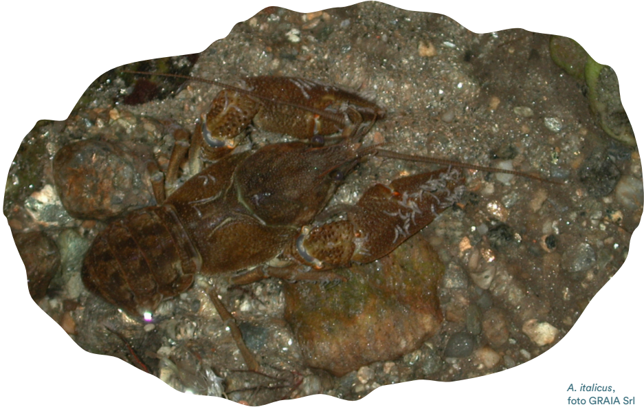
A. italicus