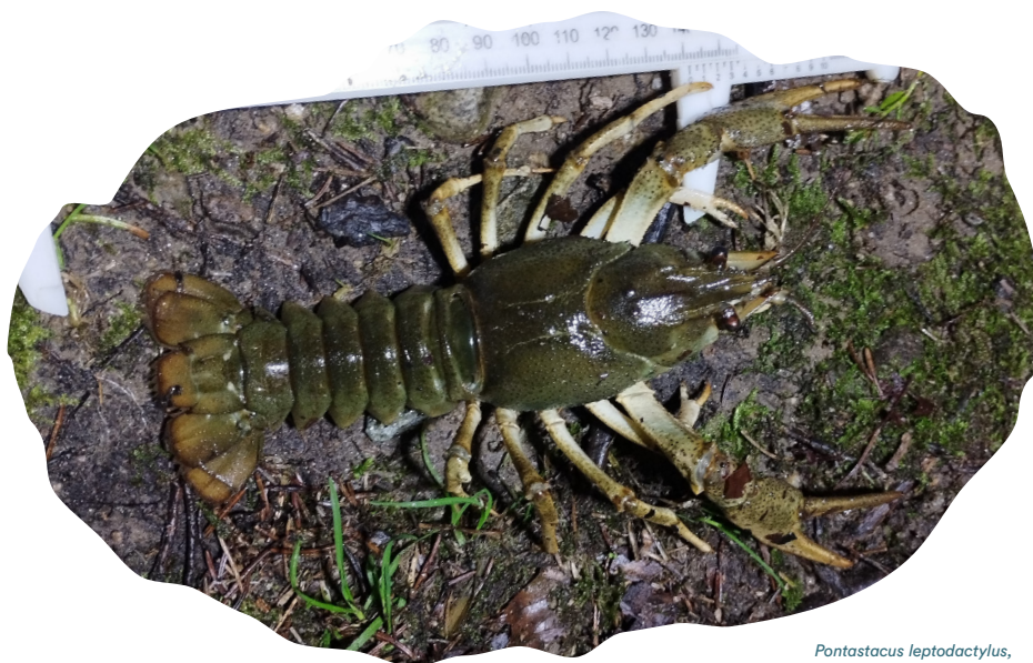
Pontastacus leptodactylus

Gambero di grosse dimensioni, raggiunge i 25 cm di lunghezza e oltre i 200 g di peso. Originario di Medioriente, Russia ed Europa centrale, si è diffuso in Europa a partire dalla Spagna dove era stato immesso. Non vi sono recenti segnalazioni della specie nel Cantone Ticino, mentre in Italia è accertata una popolazione in provincia di Varese, nell'area di progetto. La colorazione varia dal verde oliva al bruno-giallastro e sono presenti due denti post orbitali ben evidenti e chele piuttosto allungate e granulose, senza spine sul carpopodite. La specie vive sia in habitat lotici che lenticici, a substrati duri o morbidi, ed è tollerante a cambiamenti di temperatura significativi (fino a circa 25°C), a basse concentrazioni di ossigeno e ad elevate condizioni di torbidità e salinità, potendo popolare anche ambienti salmastri. Può essere superficialmente confuso con il gambero di fiume italiano, da cui differisce però per la forma del rostro e delle chele e per la presenza di due creste post orbitali. È specie prolifica ma sensibile alla peste del gambero.