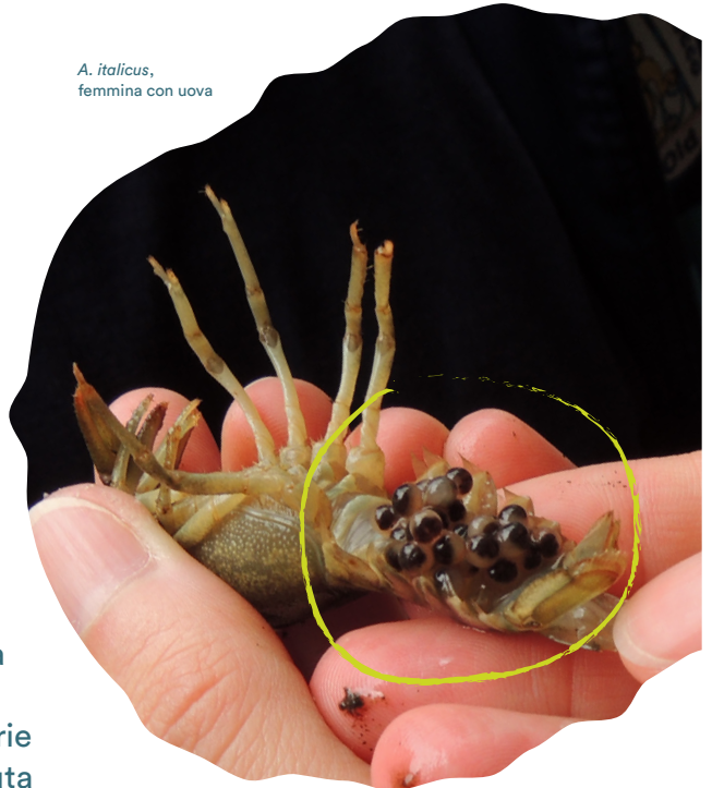
A. italicus , femmina con uova

Le larve schiuse rimangono comunque appese alla madre fino alla prima muta, mentre in seguito iniziano a condurre vita autonoma, pur rimanendo nei dintorni della madre per un certo periodo di tempo.