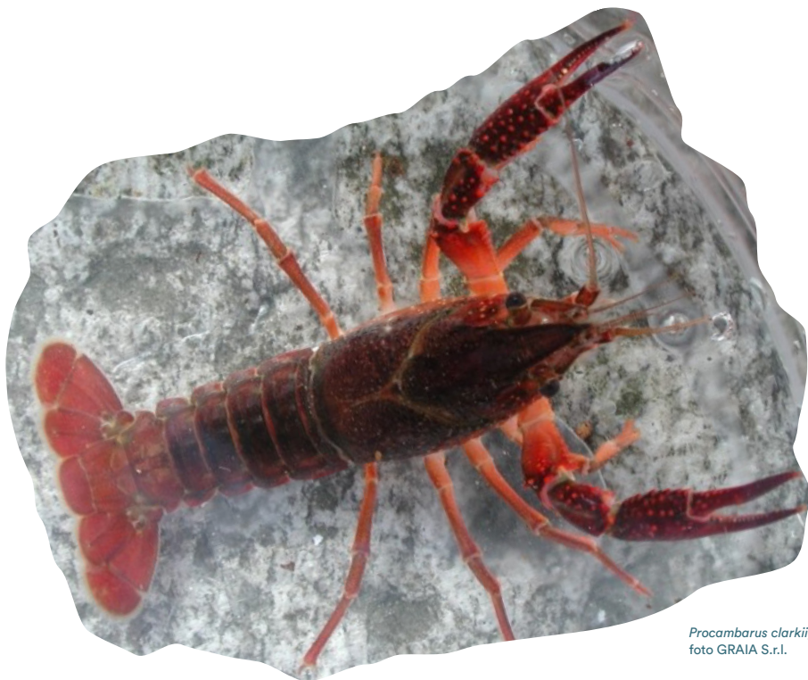
Procambarus clarkii