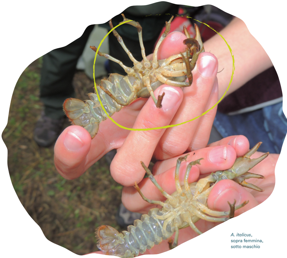
A. italicus , sopra femmina, sotto maschio

Di colore bruno olivastro e con le zampe più chiare, raggiunge dimensioni intorno ai 12 cm di lunghezza. Presenta chele robuste, particolarmente evidenti nei maschi, finemente granulose e con evidente scalino sul dito fisso. Il rostro presenta margini divergenti e carena centrale e un solo paio di creste post orbitali. Differenziare maschi e femmine è facile: il maschio presenta il primo paio delle appendici dell'addome modificate a formare due strutture detti gonopodi, utilizzate nella riproduzione. I maschi inoltre presentano chele più grosse, mentre nelle femmine è l'addome a essere più largo, per il trasporto delle uova.