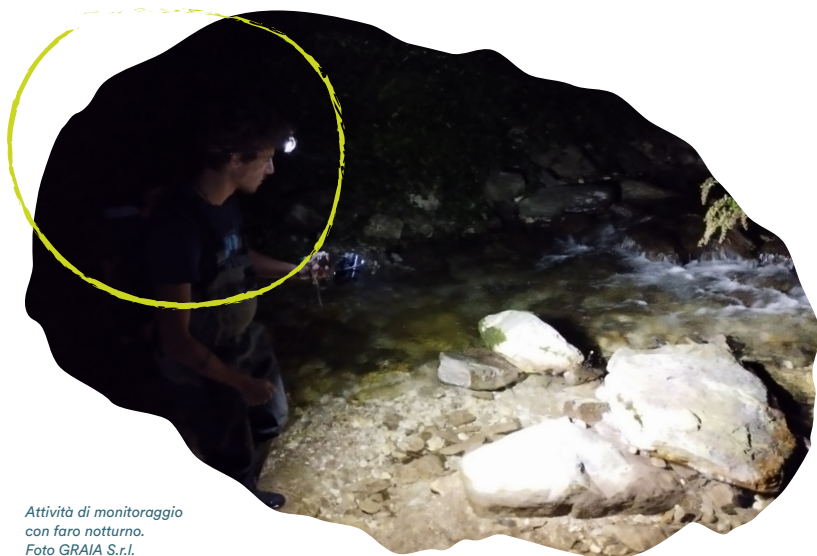
Attività di monitoraggio con faro notturno.

Il monitoraggio delle popolazioni indigene di gambero si avvale principalmente di due metodi, applicabili in situazioni diverse: il censimento a vista tramite faro e il trappolaggio tramite nasse. Il monitoraggio al faro è utilizzabile in piccoli corsi d'acqua con buona visibilità e si svolge in orario notturno, periodo di massima attività dei gamberi, e consiste nel risalire un corso d'acqua controcorrente cercando attivamente i gamberi, che vengono catturati, misurati e rilasciati. Il monitoraggio con nasse invece si svolge su più giorni e consiste nel mettere in posa delle nasse innescate, in grado di intrappolare i gamberi: le nasse vengono in seguito recuperate e si procede con le misurazioni. Quest'ultimo metodo si applica a quei corsi d'acqua dove non è possibile procedere in alveo per il censimento o dove la visibilità impedisce di vedere i gamberi. Per ulteriori informazioni sui metodi di monitoraggio si veda il "Protocollo condiviso di monitoraggio delle popolazioni di Austropotamobius italicus ", prodotto nell'ambito del progetto Interreg ECO4TICINO.