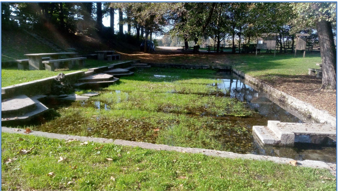
Le Sette Fontane