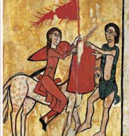
“SAN MARTINO DI TOURS E IL POVERO”, DOSSALE DI SAN MARTIN DE PUIGBO, ARTE ROMANICA CATALANA, FINE XI-INIZIO XII SECOLO, TEMPERA SU TAVOLA.

Si impegnò nella lotta contro l'eresia ariana, (condannata al I concilio di Nicea del 325), venendo per questo frustato e cacciato sia dalla Francia che da Milano, dove erano stati eletti vescovi ariani.