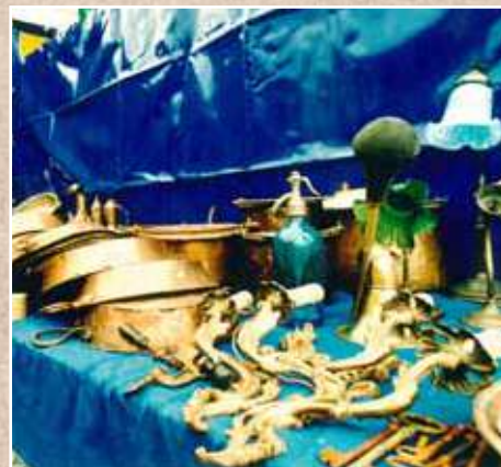
IMMAGINI STORICHE DALLE PRECEDENTI EDIZIONI DELLA FIERA DI SAN MARTINO.

Guardate anche nelle vetrine dei negozi e troverete perle di italiana creatività.