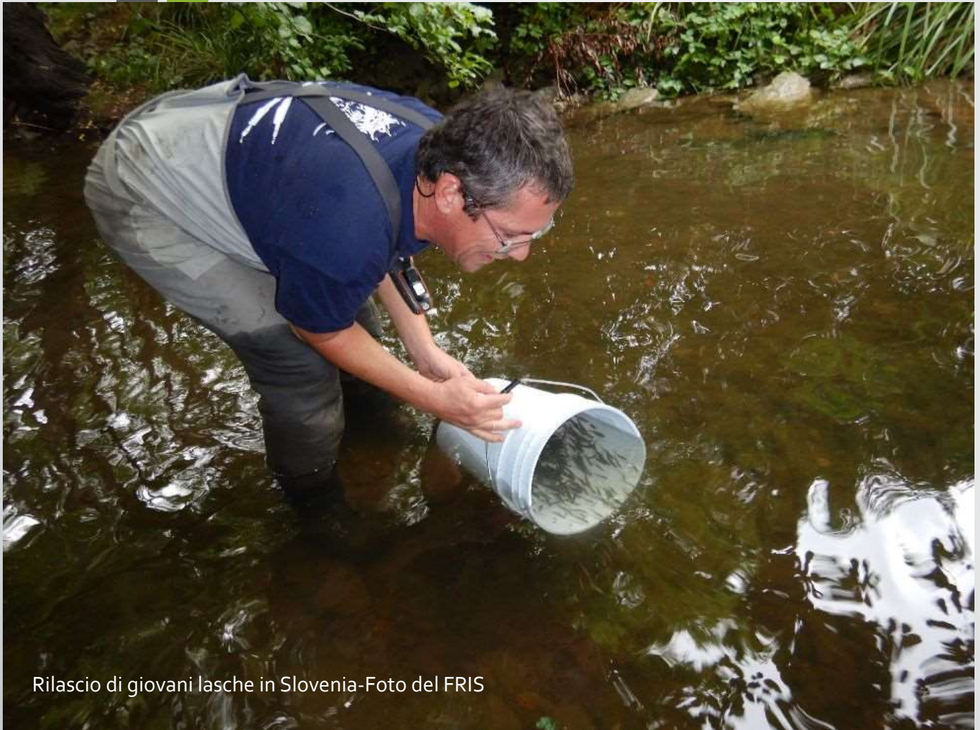
Rilascio di giovani lasche in Slovenia

Nell'ambito delle azioni dirette volte alla conservazione della lasca in Slovenia, in particolare la fornitura di lasche adulte (riproduttori) e giovani lasche nate in cattività al Fisheries Research Institute of Slovenia per avviare l'allevamento e per effettuare le immissioni in natura, in Giugno 2020 il Parco ha riprodotto le lasche presso il suo incubatoio ittico. I giovani pesci ottenuti sono stati ritirati dal FRIS e rilasciati in Slovenia. L'immissione in natura viene effettuata in ambienti ritenuti idonei a seguito di diverse analisi. Anche lo scorso anno il Parco ha trasferito al FRIS le lasche nate in cattività, le quali sono state subito liberate nei corsi d'acqua sloveni. Questi pesci sono sopravvissuti all'inverno , dato che conferma la buona scelta del sito di rilascio da parte del FRIS.