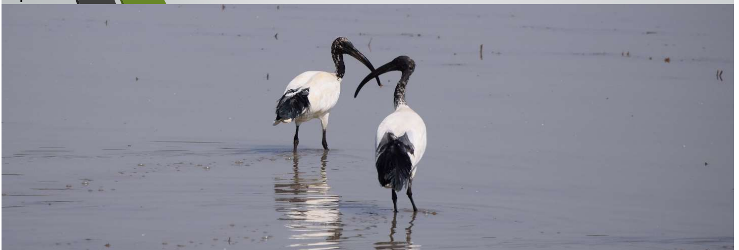
Ibis sacro: specie aliena del Parco del Ticino

IL programma comunitario LIFE, tramite il sub programma «Natura e biodiversità» finanzia progetti di conservazione della natura volti ad arginare la perdita di biodiversità, processo che va avanti ormai inesorabilmente da decenni. Uno dei «termometri» che misura ogni anno la perdita di Biodiversità in Italia è fornito dall'insieme dei dati e delle informazioni raccolte dalle ARPA (agenzie regionali per la protezione ambiente) che convergono in un Osservatorio nazionale gestito da ISPRA (istituto Superiore per la protezione dell'Ambiente). Dal 2016, infatti, è stato istituito il Sistema nazionale a rete per la protezione dell'ambiente (SNPA), del quale fanno parte ISPRA e le agenzie regionali ARPA, con una funzione di rete di controllo di qualità dell'ambiente anche per gli aspetti concernenti la biodiversità di specie animali e vegetali. Ciclicamente il SNPA svolge monitoraggi sullo stato della biodiversità italiana. L'ultimo ciclo di monitoraggio, svoltosi tra il 2013 e il 2018 (IV Report), è stato presentato nel 2019. Questo documento mostra lo stato di conservazione attuale delle specie animali e vegetali, le minacce e le criticità, le possibili azioni da intraprendere per migliorare la situazione e un confronto con il ciclo precedente (III Report, anni 2007-2012 ) oltre ad avere una sezione dedicata alle specie esotiche invasive.