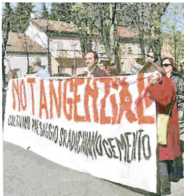
La manifestazione di sabato contro la tangenziale