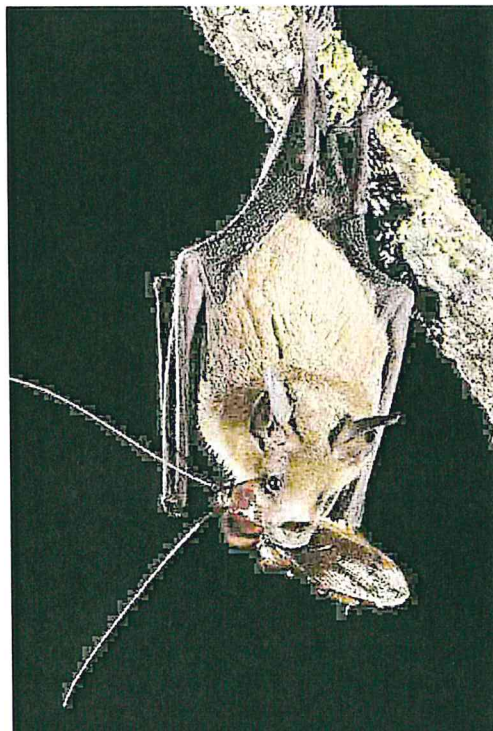
I pipistrelli sono cacciatori di zanzare