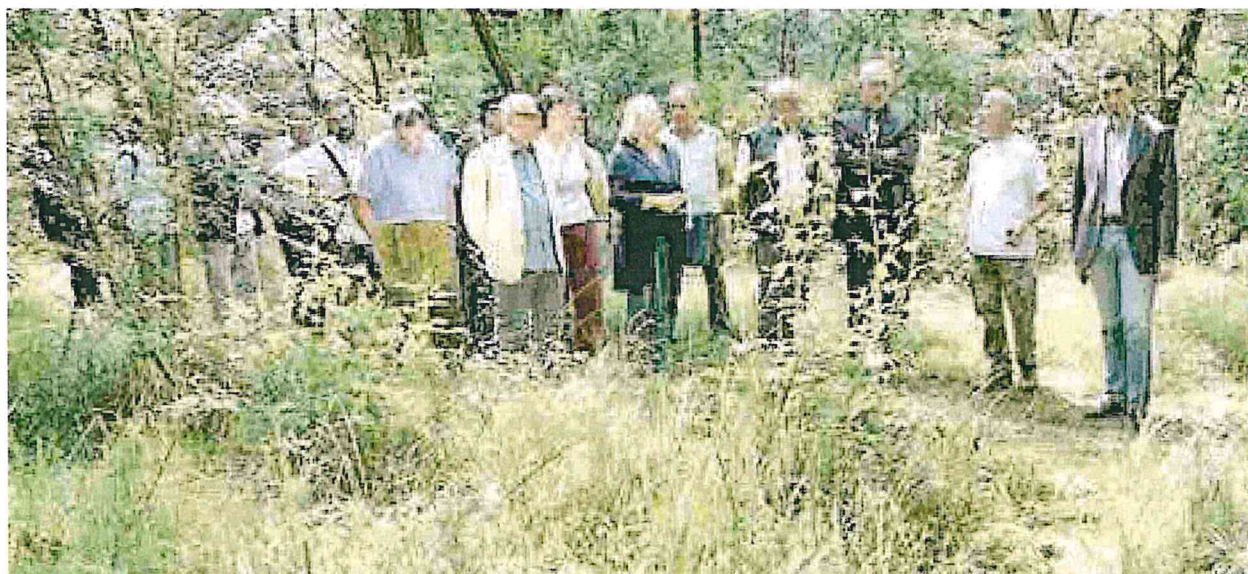
Un momento della visita al percorso faunistico, inaugurato ieri mattina, allestito lungo i sentieri del Parco del Ticino

VIGEVANO INAUGURATI IERI IL BOSCO DIDATTICO E IL PERCORSO FAUNISTICO