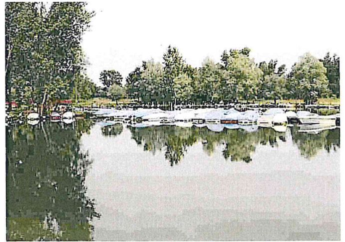
Uno scorcio della lanca dell'Ayala lungo il Ticino