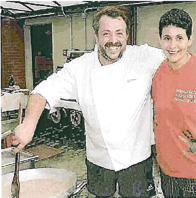
CHEF In Fiera cucineranno il risotto i cuochi del ristorante Charlie (nella foto) di Albairate, Kitchen & Coffee e osteria Santa Maria