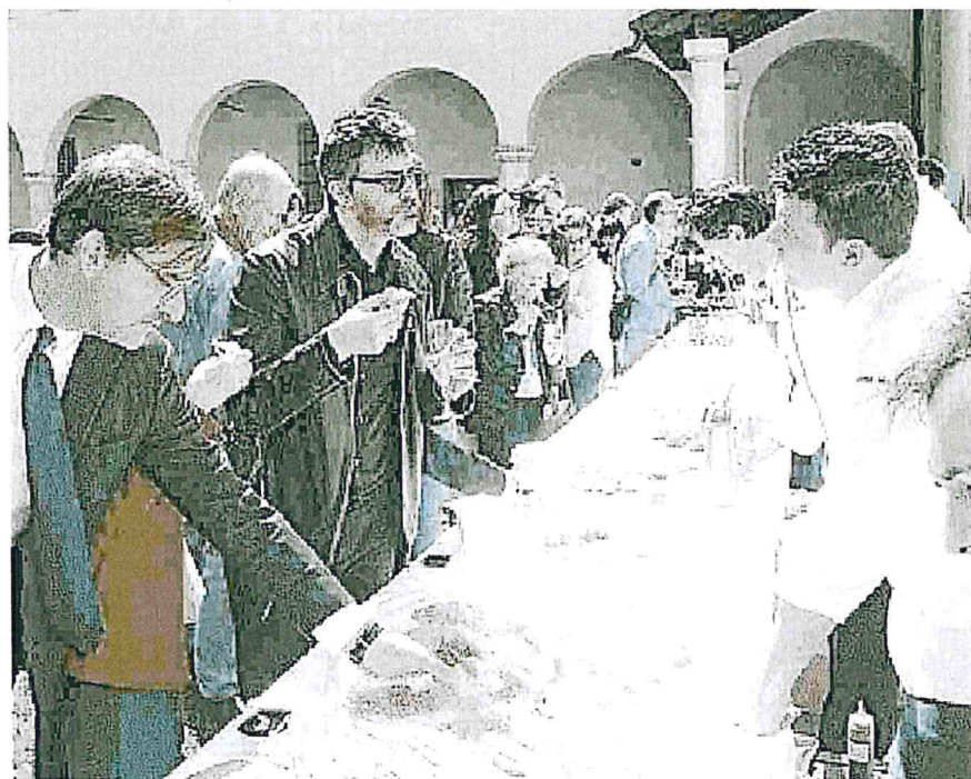
ECCELLENZE Moltissimi i partecipanti agli showcooking dei giovani chef