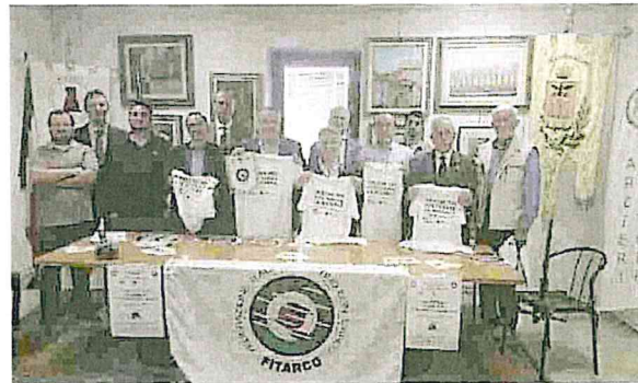
Domani parte la Coppa Italia di tiro con l'arco

Si tratta, quindi, dell'evento più atteso dal movimento italiano, per il suo alto tasso di "campanilismo", che vedrà fino a domenica in gara circa 600 atleti ap-